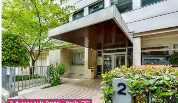
2-4, rue Louis David – Paris (75)